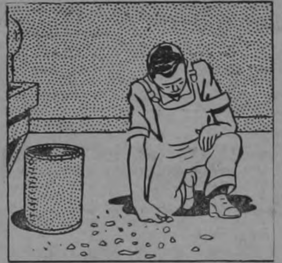
Para evitar caídas peligrosas recoja los residuos que hayan alrededor de su puesto de trabajo.

Para muchos serán simples advertencias; para otros serán verdaderas lecciones que aprovecharán en su propio bien y en el bien de sus compañeros.