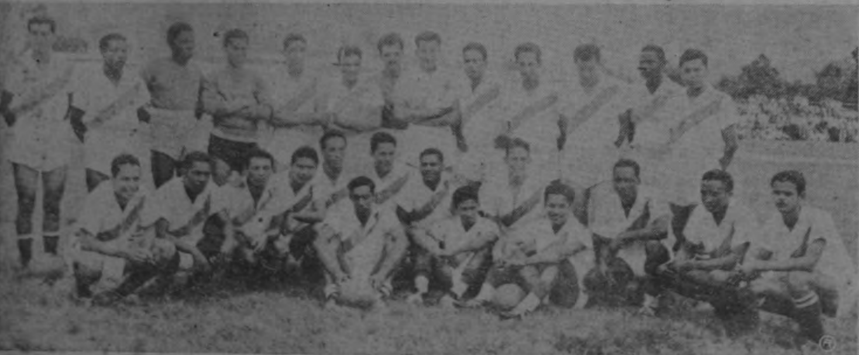
Selección que representará a Honduras en el torneo de fútbol que se iniciará el domingo 8.