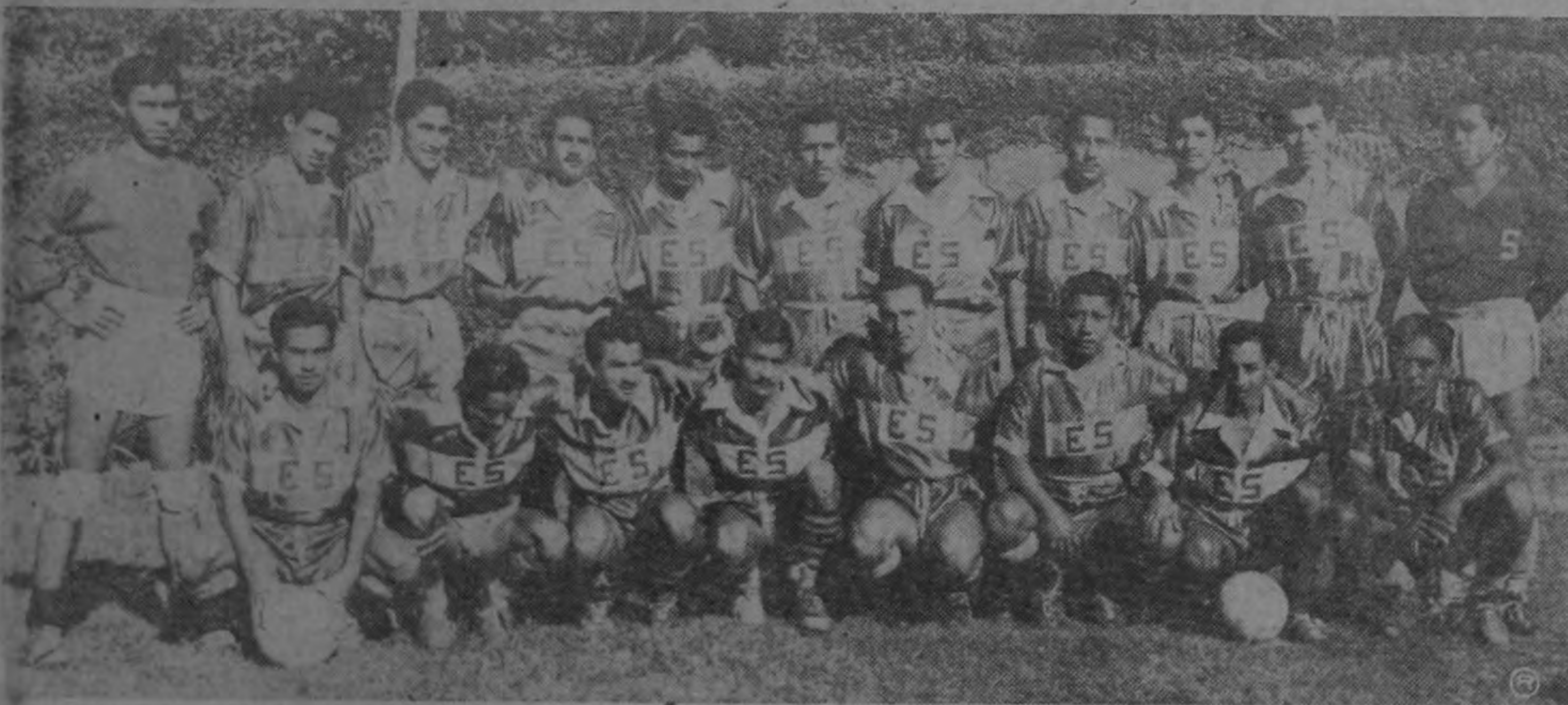
Selección salvadoreña al VI Campeonato Centroamericano y del Caribe de Fútbol