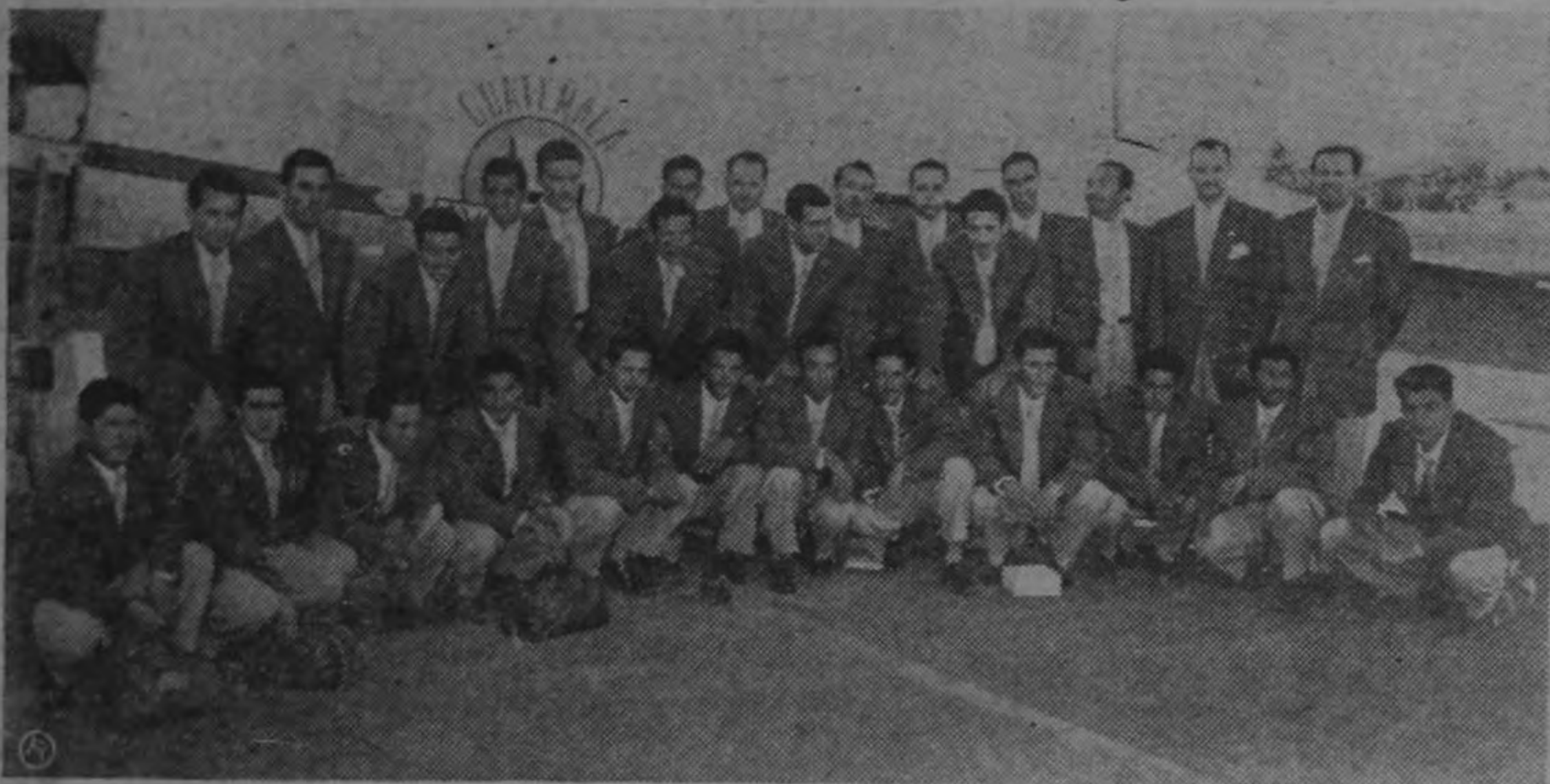
Selección de Fútbol de Guatemala, que ayer llegó por vía aérea para participar en el Sexto Campeonato Centroamericano y del Caribe.