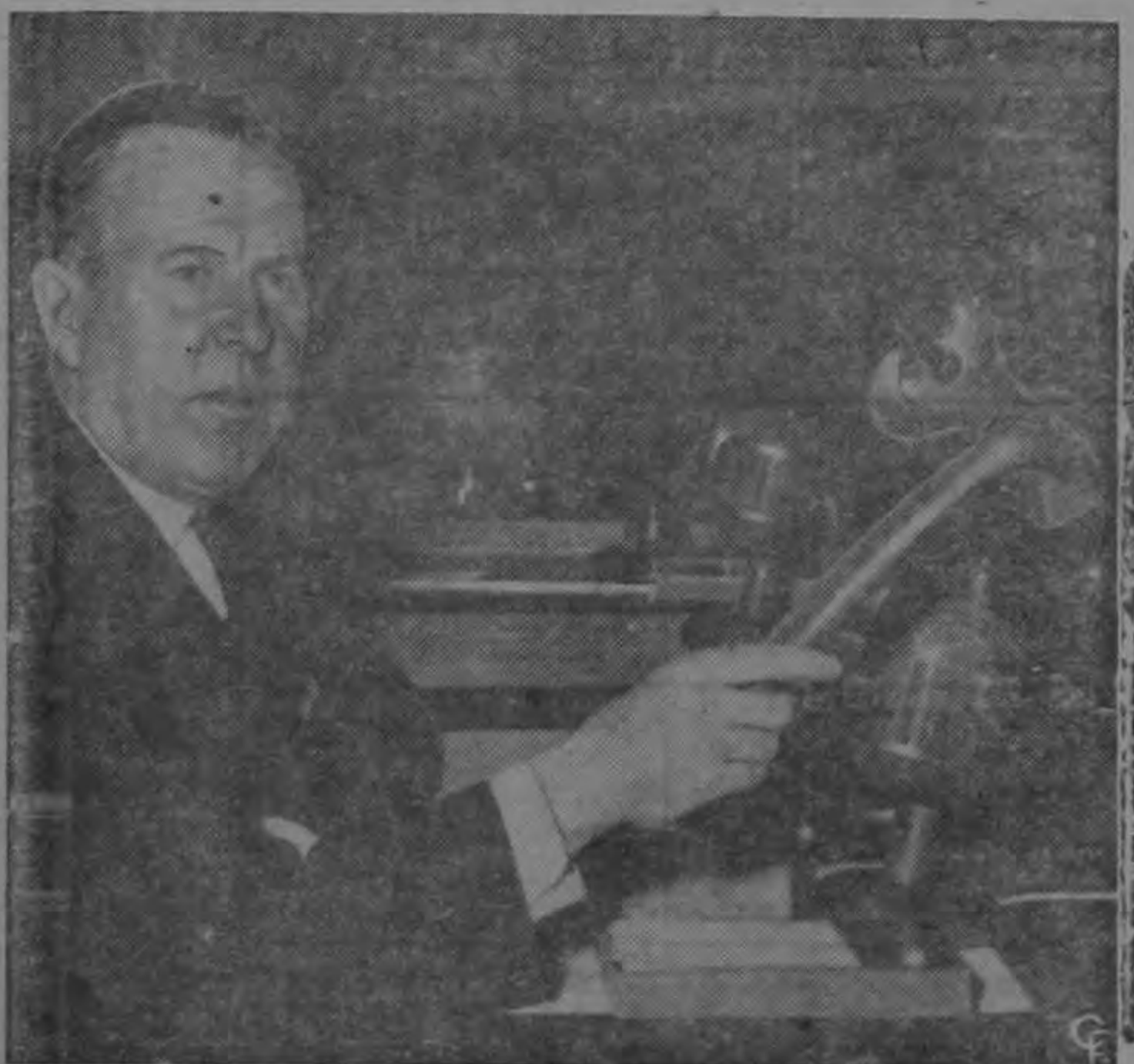
El Presidente de la Asamblea, Lester B. Pearson, del Canadá, llama a los delegados al orden al reiniciar la Asamblea de las Naciones Unidas sus sesiones en Nueva York. Pearson presentó un informe escrito sobre la repatriación de los prisioneros de guerra "como punto de partida para erandudar el debate sobre la Corea".